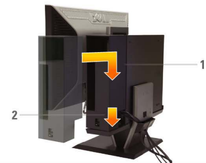
8 Connect the power cables to an outlet. Install the cable cover

Schließen Sie USB-, Tastatur- und Maus kabel wie gezeigt an den Computer an Branchez les câbles USB de la souris et du clavier à l'ordinateur tel qu'illustré Conecte los cables USB, de teclado y ratón al equipo, como muestra la imagen W pokazany sposób podłącz do komputera kabel USB, klawiatury i myszy Conecte os cabos USB, do teclado e do mouse ao computador como mostrado Collegare il cavo USB, quello della tastiera e quello del mouse al computer come mostrato